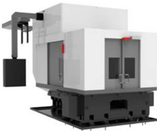
Kabina pro víceřetenný obráběcí stroj s automatickým výměníkem nástrojů.

Součástí řešení kabin pro prostorově náročné stroje, nebo celé výrobní linky nabízíme i konstrukci a výrobu ohrazení celého technologického celku.